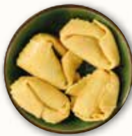
Tortellone spinaci e ricotta