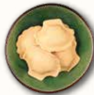
Conchiglie al salmone