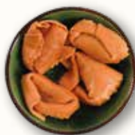
Tortellone di zucca