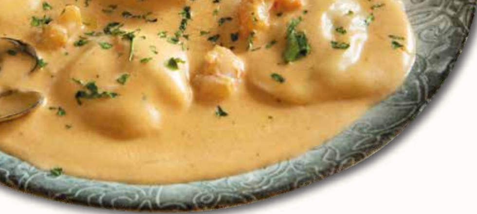
Panciotti di capesante e gamberi