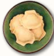
Conchiglie di salmone