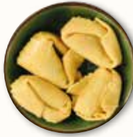
Tortellone spinaci e ricotta