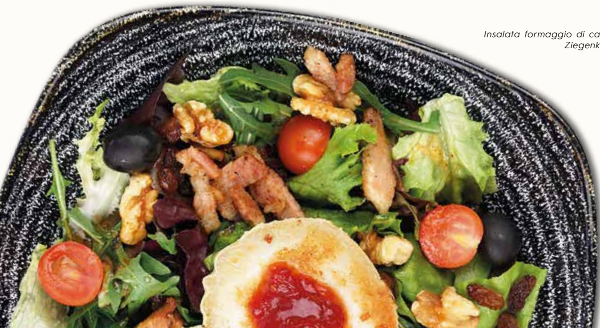
Insalata formaggio di capra Ziegenkäse