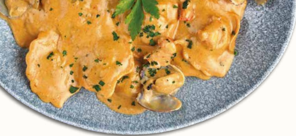
Panciotti di capesante e gamberi