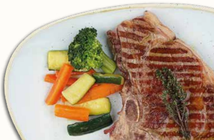
Entrecote ai ferri Entrecote gegrillte